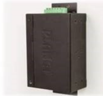
Wall mounting (Space saving)