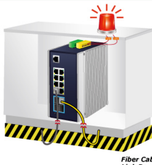
Fiber Cable Link Down