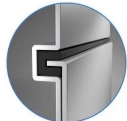
Sealed Lock-and-Key Design

Na zadní straně je k dispozici celá řada portů, mezi nimiž vyčnívá především rozhraní HDMI 2.0 , které zajistí snadné promítání 4K obsahu při vyšším jasu a kontrastu oproti standardnímu rozlišení. Jas je klíčem k viditelnosti. I proto nabízí projektor BenQ LU9245 funkci dynamického tlumení jasu dle scény a optimalizuje světelný výkon a kontrast pro co nejlepší obraz.