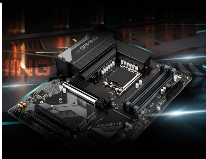
GIGABYTE B760 GAMING X DDR4