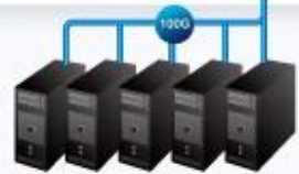
HPC Servers / All-Flash Storage