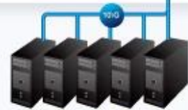
Existing 10G/ Edge Devices